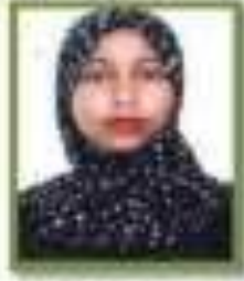
عمیرہ عروجہ عیسیٰ بھنگلہ خزانہ