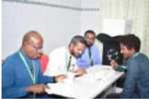
ملف العمل على تطوير التعليم في المدارس

تمت الموافقة على خطة العمل الاستراتيجية للوزارة للعام 2003/1 (عقد الاجتماعات السنوية) في مؤتمر الوزير في 30/15/2015 (مؤتمر العمل على تطوير التعليم في المدارس). وتمت الموافقة على خطة العمل الاستراتيجية للوزارة للعام 2022 في 04 أيلول 2022 في اجتماع المجلس الأعلى للتعليم، حيث تم الاتفاق على خطة العمل الاستراتيجية للوزارة للعام 2022 في 23 أيلول 2022 في اجتماع المجلس الأعلى للتعليم. وتمت الموافقة على خطة العمل الاستراتيجية للوزارة للعام 2022 في 23 أيلول 2022 في اجتماع المجلس الأعلى للتعليم.